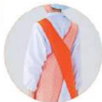
※2010最新柄 くまモン #K27784