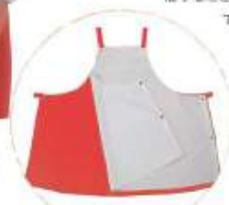
防水カバー取付時

では、揚げ物等で使用される高温油に対しては撥油性が小さく、また洗濯耐久性も十分ではありませんでした。エスメニガードHOは従来の撥水撥油加工では達成できなかった高温油に対する撥油加工で優れた洗濯耐久性を有しています。