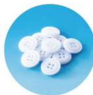
割れにくい厚手のボタンを使用