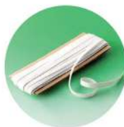
袖口には巾12mmのゴムを使用

生地がしっかりしたままで、へなへなの袖口ゴムや付け替えて形の違うボタンでは、がっかりです。「らくらく給食衣」は付属品にもこだわりました。