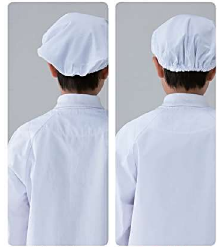
従来の給食衣 ノンケア給食衣

形態安定性の高い繊維です。 交織のポプリンを使うことで、素材の安定性を高めました。洗濯後たたんでいただくだけで、気になるシワをブロックします。