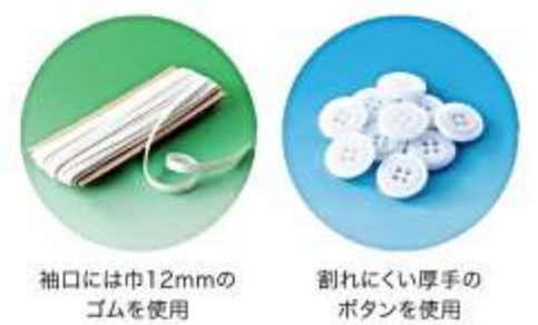
袖口には巾12mmのゴムを使用

付属品(ゴム・ボタン等)も厳選しています。 生地がしっかりしたままで、へなへなの袖口ゴムや付け替えて形の違うボタンでは、がっかりです。「らくらく給食衣」は付属品にもこだわりました。