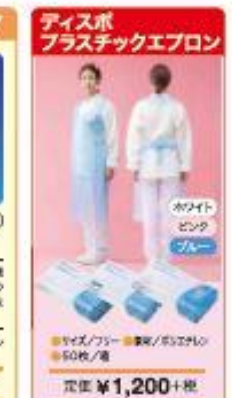
Disposable プラスチックエプロン