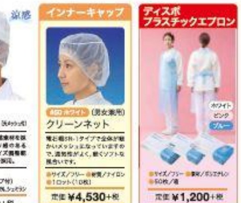
インナーキャップ