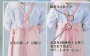
ウエストの調節方法 (2段階)