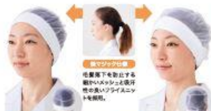
後でツバがはまる

作業時下部を巻くことで 髪がヘアメッシュと吸着 性の高いウレタンネット を形成。