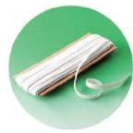
袖口には巾12mmのゴムを使用

付属品(ゴム・ボタン等)も厳選しています。生地がしっかりしたままで、へなへなの袖口ゴムや付け替えて形の違うボタンでは、がっかりです。「らくらく給食衣」は付属品にもこだわりました。