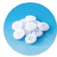
割れにくい厚手のボタンを使用