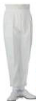
HB31-10 ホッピングパンツ (男女兼用)