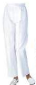
HB10-40 女性用トレパン (裾ゴム入り)