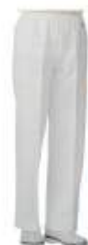
HB30-10 ニットパンツ (男女兼用)