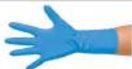
423060 ニトリル手袋 GLOVE50