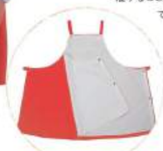
防水カバー取付け時

では、揚げ物等で使用される高温油に対しては撥油性が小さく、また洗濯耐久性も十分ではありませんでした。エスメニガードHOは従来の撥水撥油加工では達成できなかった高温油に対する撥油加工で優れた洗濯耐久性を有しています。