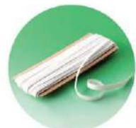
袖口には巾12mmのゴムを使用

付属品のみも販売 強い付属品を使っても、どうしても限界があります。本体の給食衣をいつも快適に着ていただくために付属品のみの販売にも対応しています。