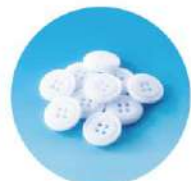
割れにくい厚手のボタンを使用